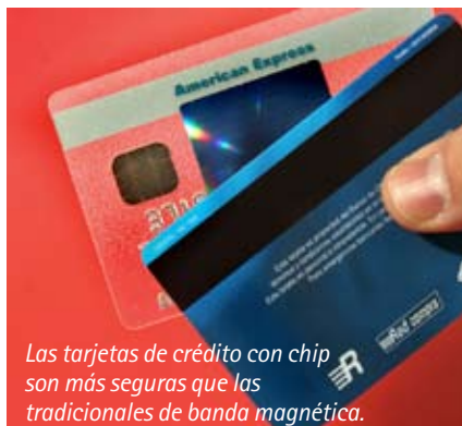
Las tarjetas de crédito con chip son más seguras que las tradicionales de banda magnética.

A juicio del académico las tarjetas nacionales usan una tecnología de cinta magnética que "está obsoleta y es tremendamente insegura, ya que es muy fácil de copiar y las máquinas que permiten clonarlas son muy baratas", por lo que la tendencia debiera ser que los bancos nacionales adopten la tarjeta con chip, porque "se están dando