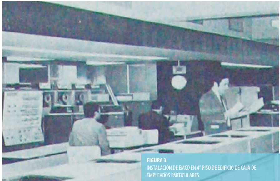
FIGURA 3. INSTALACIÓN DE EMCO EN 4º PISO DE EDIFICIO DE CAJA DE EMPLEADOS PARTICULARES.

La creación de la empresa y la instalación del computador pasaron prácticamente desapercibidos para la prensa y la opinión pública. La inauguración del nuevo computador y la presentación de EMCO ocurrieron el jueves 16