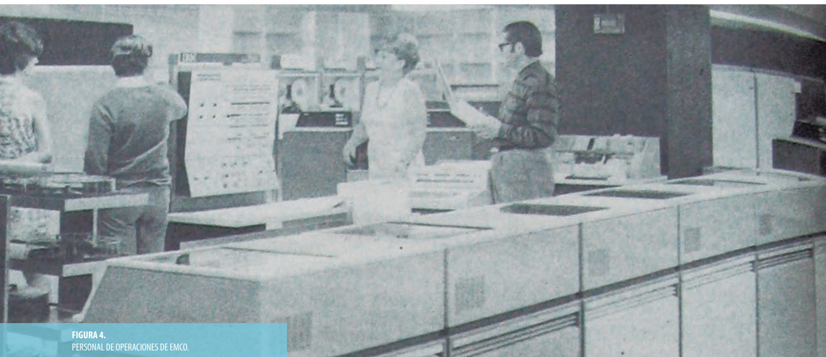
FIGURA 4. PERSONAL DE OPERACIONES DE EMCO.

Dos meses después, en abril de 1969, con motivo de los 30 años de la CORFO, el diario La Nación publicó una página completa titulada “Silencioso servidor público y obediente colega”. En uno de sus párrafos definía la importancia de la empresa para el Estado: “EMCO juega un papel esencial, como un gran sistema que combina sabiamente la técnica electrónica con la inteligencia humana. Un sistema ágil y exacto que permite una racionalización de todos los organismos del Estado prestando la asesoría adecuada para lograr que toda la información sobre los componentes decisivos del sistema económico, social y cultural del país esté debidamente organizada, actualizada y rápidamente accesible para su empleo racional” [20].