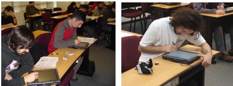
Fig. 3. Experimentación con MOCET

Por otra parte, los instructores consideraron que la herramienta ha reducido, al menos en la mitad, el esfuerzo requerido para aplicar la técnica de evaluación. Todos ellos consideraron que el proceso de evaluación y calificación fue justo. Más aún, mencionaron que los elementos brindados para soportar el proceso de compartir el conocimiento y la escritura libre, fueron de los aspectos más relevantes.